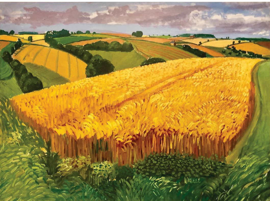
Дејвид Хокни: Поља пшенице надомак Фрајдејторпа (2005)